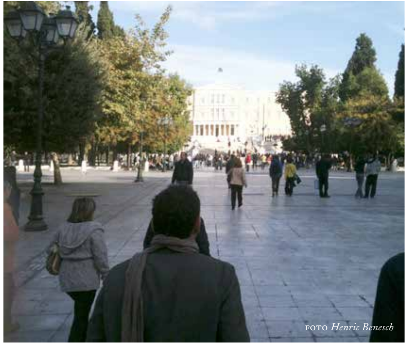
Till höger Syntagmatorget, Aten.